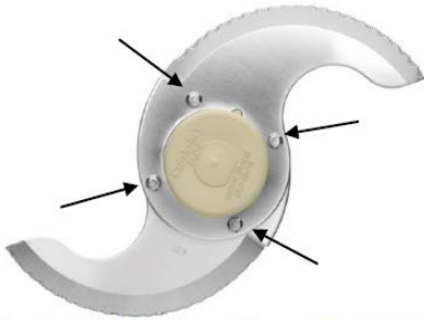
Riveted Blade in Cuisinart Food Processor

Lame rivetée dans un robot culinaire Cuisinart