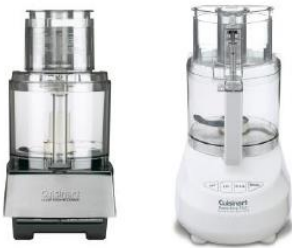
Exemples de Cuisinart Food Processors with Riveted Blades

Lame rivetée dans un robot culinaire Cuisinart